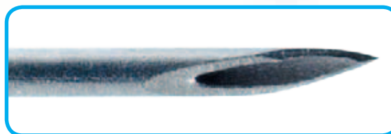
Увеличенное фото кончика иглы. Вверху: игла до использования Внизу: игла после инъекции